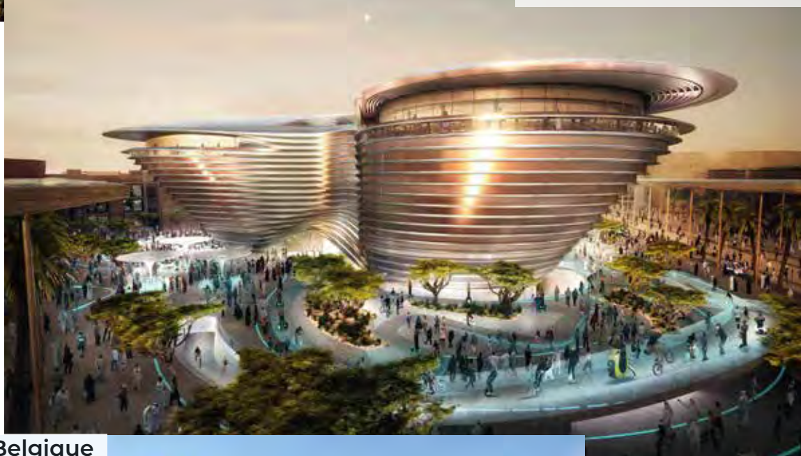
Pavillon de la Belgique