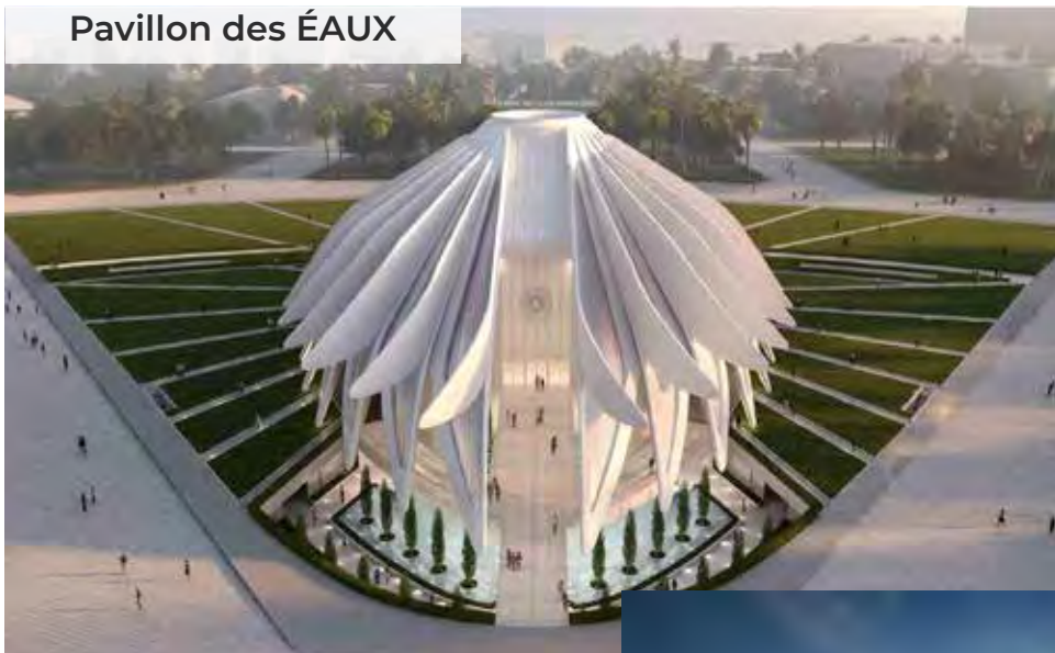
Pavillon des ÉAUX