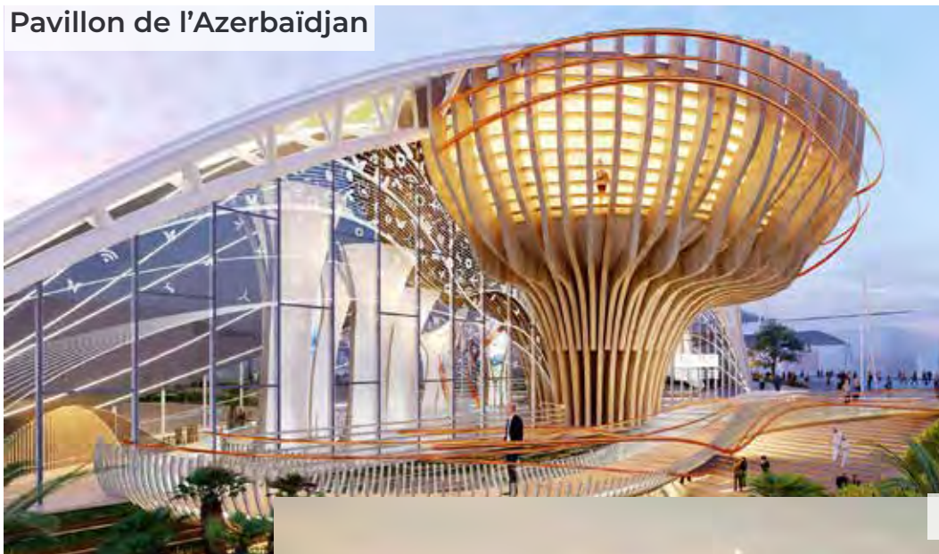
Pavillon de l'Azerbaïdjan